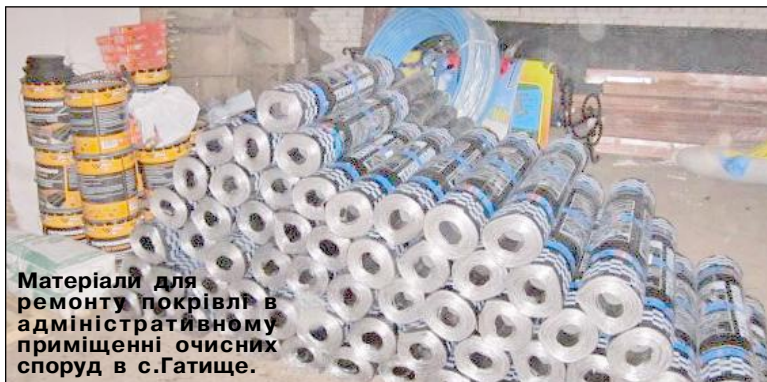
Матеріали для ремонту покрівлі в адміністративному приміщенні очисних споруд в с.Гатище.