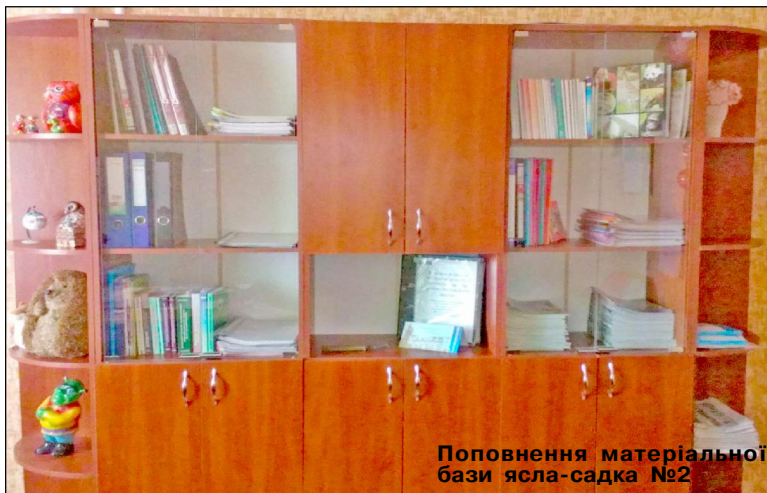
Поповнення матеріальної бази ясла-садку №2