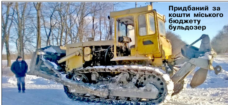
Придбаний за кошти міського бюджету бульдозер